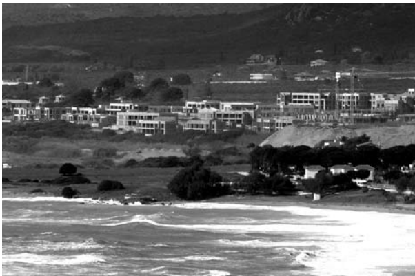
Φωτογραφίες 7 και 8 (βλ. παράρτημα) Με εννέα γερανούς του ΑΚΤΩΡ συντελείται η... ήπια τουριστική ανάπτυξη στον Ρωμανό!

φορα ζητήματα που φαίνονται άσχετα μεταξύ τους εντάσσονται στον ίδιο εξελικτικό κύκλο της κοινωνικής και πολιτικής ανάπτυξης – ή μη ανάπτυξης. Στην Ελλάδα, όπως όλοι γνωρίζουμε, δεν πραγματοποιήθηκε η Βιομηχανική Επανάσταση που έλαβε χώρα στη Δυτική Ευρώπη. Συνεπώς, το βιομηχανικό προϊόν της χώρας είναι από μηδαμινό έως περιορισμένο. Μάλιστα, σε αρκετές περιπτώσεις η βιομηχανική και τεχνολογική πρόοδος και καινοτομία αυτής της χώρας εμποδίστηκε, και μάλιστα εκ των έσω. Η Ελλάδα δεν έπρεπε να γίνει χώρα παραγωγής σύγχρονων τεχνολογικών προϊόντων, αλλά μόνο καταναλώτριά τους. Τώρα θα σκεφτεί κανείς: τεχνολογική πρόοδος και καινοτομία στην Ελλαδίτσα; Δεν ξέρω για την Ελλαδίτσα. Ξέρω όμως για τους Έλληνες. Οι οποίοι στο εξωτερικό όχι μόνο διαπρέπουν, αλλά αποτελούν κομμάτι του πιο έξυπνου και καινοτόμου παραγωγικού και επιστημονικού δυναμικού. Και