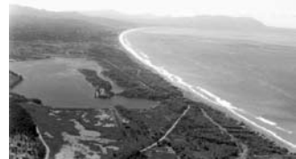
φωτογραφία 9 (βλ. παράρτημα)

Τον Καϊάφα όμως; Γιατί να τον κάψουν; Τι επένδυση θα κάνουν στα αποκαϊδία; Κι όμως! Η περιοχή του Καϊάφα και της Ζαχάρως ήταν ιδανικής ομορφιάς και σχεδόν ανεκμετάλλευτη: βρίσκεται πάνω από μια αμμουδερή ακτογραμμή εντελώς απείρακτη. Πολλά χιλιόμετρα χωρίς «ανάπτυξη». Η λίμνη Καϊάφα βρισκόταν μέσα σε προστατευόμενη περιβαλλοντική ζώνη. Κι έτσι, οι επίδοξοι «επενδυτές» ήταν με δεμένα τα χέρια. Κάποιοι, όμως, έχουν προσπαθήσει εδώ και καιρό να τους τα λύσουν. Με σημαντικά ανταλλάγματα. Και ποιος είναι ο τρόπος να λύσεις τα χέρια του επενδυτή; Μα, φυσικά, να του εξασφαλίσεις τη νομιμότητα της επένδυσής του: κανένας επενδυτής δεν θέλει να είναι παράνομος, διότι τότε η επένδυσή του είναι επισφαλής. Έτσι, λοιπόν, βλέπουμε πως οι νόμοι και οι κρυφές τροπολογίες –που είναι αντισυνταγματικές– κατοχυρώνουν τους συνδιαλεγόμενους.